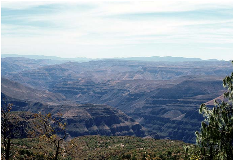
Sierra Madre Occidental 1978

Los huicholes llevan muchos siglos viviendo en los estados de Nayarit y Jalisco del centro occidental de México donde están asentados ahora. Según el arqueólogo, Dr. Phil Weigand, ellos y sus vecinos lingüísticos, los coras, ya habían establecido sus raíces en esta zona cuando empieza la temporada clásica mesoamericana (200 a 700 de nuestra era) 1 . La rama corachol de estos idiomas de la familia uto-azteca lleva a lingüistas como Valiñas, citado por Weigand a considerar la relativa antigüedad de este grupo de idiomas en esta zona. "Esta rama del uto-azteca está mucho más emparentada con las ramas del tarachitán y del tepimán habladas en el norte y el oeste que con los idiomas nahuas hablados más al este y al sur." 2