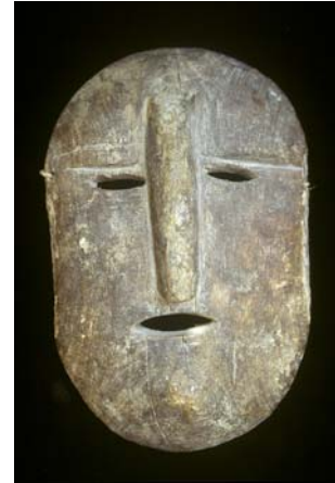
Mascara de Takutsi

Aunque los huicholes no han permitido excavaciones arqueológicas dentro del territorio comunal en el que están asentados a la fecha, la arqueóloga Marie-Areti Hers es reconocida por haber trabajado en la periferia de lo que fuera su territorio, cuando los españoles conquistaron esa zona. Cerca de Huejuquilla el Alto, excavó una piedra labrada que interpreta como un chac-mool prototípico. La describe como una figura andrógina acostada pero con una vigorosa tensión, cuyos ojos están bien abiertos hacia el firmamento 6 , y parece ser del periodo clásico, antes de las esculturas características de chac-mool de la época posclásica que fueron desarrolladas por los toltecas. Sugiere que el recipiente redondo en la cavidad central del chac-mool tradicional pudiera haber evolucionado de una jícara votiva como las que los huicholes usan para poner ofrendas de sangre, peyote molido y atole. También especula que esta deidad puede haber representado un oráculo, lo cual nos recuerda la interpretación huichola de Nuestra Bisabuela Gran Oreja, Takutsi Nakawé , profetiza del diluvio.